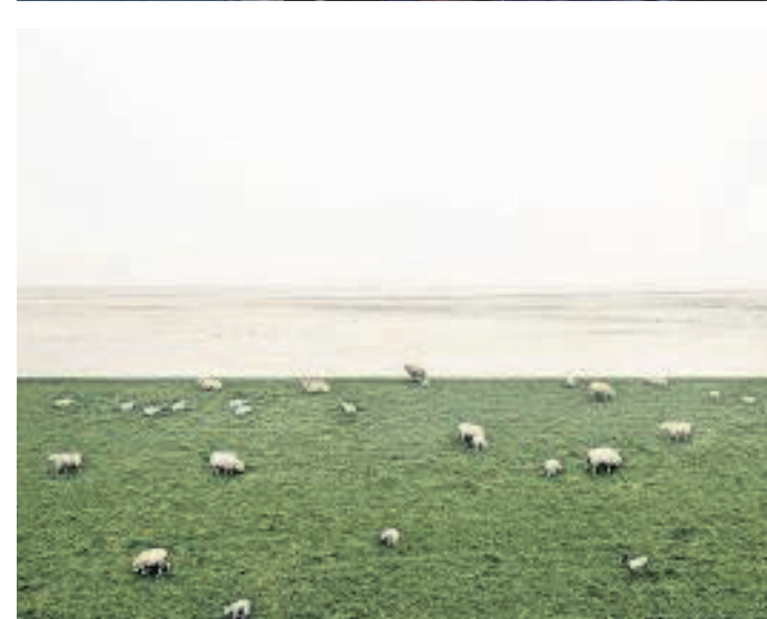
→ Hoogwerkerfoto's van de Wadden met van bovenaf het drenkelingenhuisje op Vlieland, de aanlegplaats van de veerboot in Ameland en schapen op Texel.